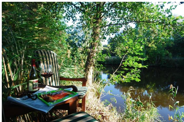
Sitzplatz an der Medem. Beobachten Sie die Eisvögel und nutzen Sie die Spiel- und Liegewiese im Grünen vor dem Haus der Vermieter.

Das Haus ist freistehend und verfügt über eigenen Eingang, Garten, Terrasse, Loggia und Carport und eine abschließbare Fahrradgarage .