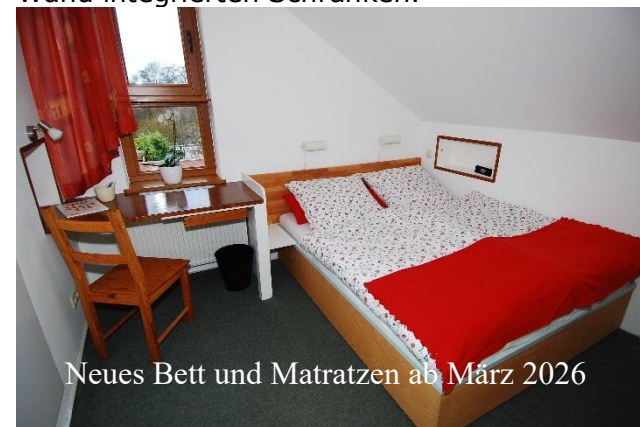
Neues Bett und Matratzen ab März 2026

Ihre Kleidung verstauen Sie in den, in die Wand integrierten Schränken.