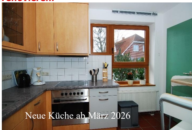
Neue Küche ab März 2026

Im Erdgeschoß befinden sich Küche, Wohnbereich und Bad (neu März 2022). Für Ihren Komfort sind Spülmaschine , Backofen, Ceranfeld, Waschmaschine , Trockner , Kaffeemaschine, Toaster, Sandwicheisen, TV (HD, 32") , DVD, HiFi-Anlage, WIFI (unverbindlich) usw. vorhanden. Im Februar 2026 werden wir umfangreich renovieren.