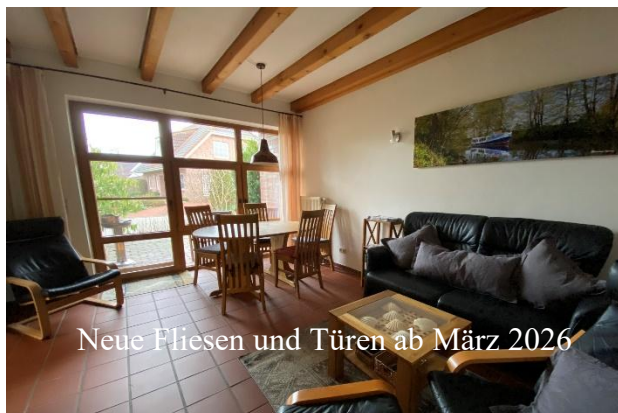
Neue Fliesen und Türen ab März 2026

Im Erdgeschoß befinden sich Küche, Wohnbereich und Bad (neu März 2022). Für Ihren Komfort sind Spülmaschine , Backofen, Ceranfeld, Waschmaschine , Trockner , Kaffeemaschine, Toaster, Sandwicheisen, TV (HD, 32") , DVD, HiFi-Anlage, WIFI (unverbindlich) usw. vorhanden. Im Februar 2026 werden wir umfangreich renovieren.